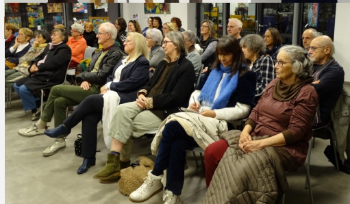
Conférence avec Le banquet des Arts, de la Culture et des Sciences