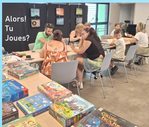
Alors! Tu Joues?